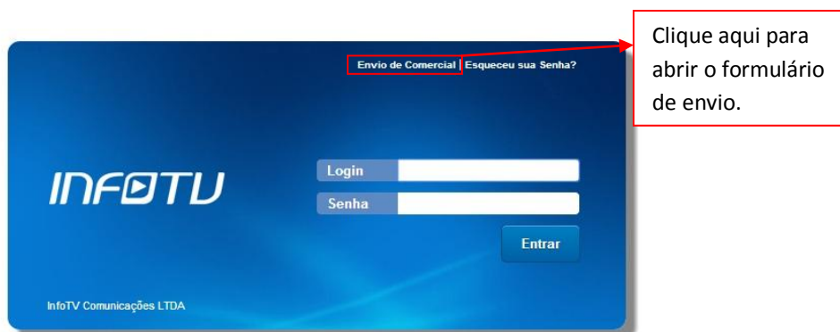
Figura 1.1: Formulário de envio de comercial – Link de acesso

A tela de login irá abrir. Se você já fez o login no sistema, deverá sair para ter acesso a esta tela. Nesta tela de login, clicando em “Envio de Comercial” no topo da janela, irá abrir o formulário de Envio de Comercial.